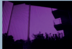
Ansicht im UVA-Bereich

Die Folie ist im UVA-Bereich des Sonnenlichts aktiv.